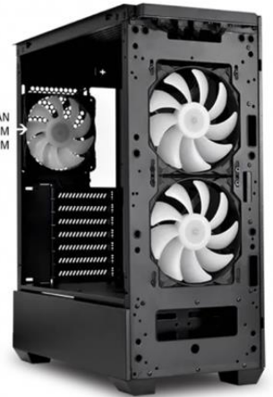
Rear PWM ARGB FAN Size: 120MM Max Speed: 1500 RPM