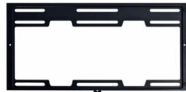
Doesn't include in LANCOOL 205M.